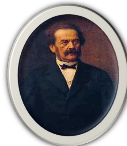
Leopold Kronenberg (1812 -1878) Finansista i filantrop Założyciel Banku Handlowego w Warszawie S.A.